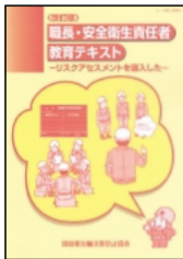
職長・安全衛生責任者教育用